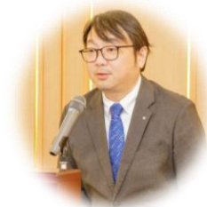
会長エレクト 杉谷会員

又、新旧委員長の引き継ぎ式について 4月9日（木）夜になります。担当の、今年度の委員長と次年度の委員長の方達で情報共有していただければと思います。よろしく願いいたします。