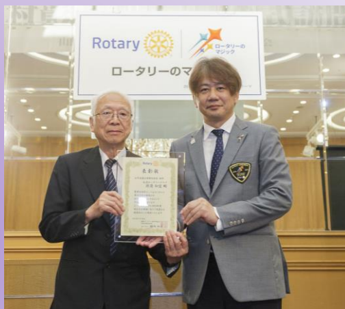
三村ガバナーより表彰式