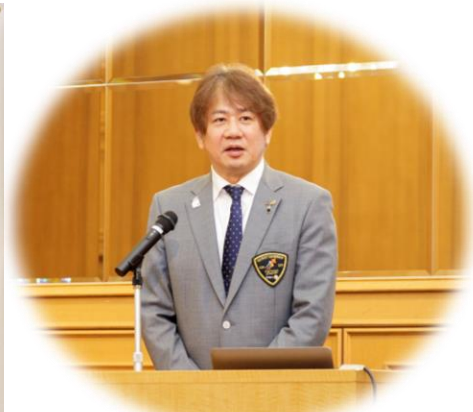
【ガバナー挨拶】 三村彰吾ガバナー