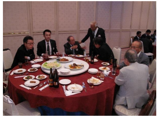
人吉 RC 60 周年記念式典 人吉カルチャーパレス