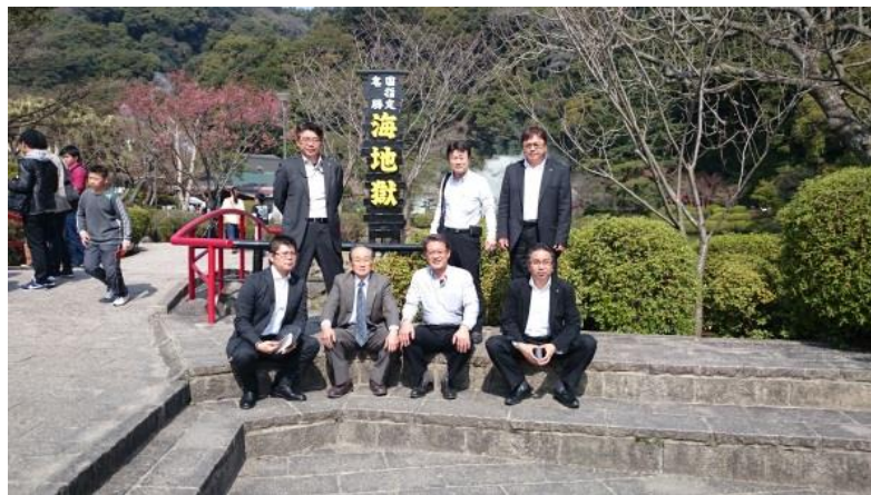
本日のお花見例会